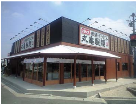
※写真は丸亀製麺 菰野店

今後も当社は、丸亀製麺を中心とした積極的な出店を継続する方針であり、中期的目標である総店舗数 300 店舗に向けて店舗数の増加に努めてまいります。