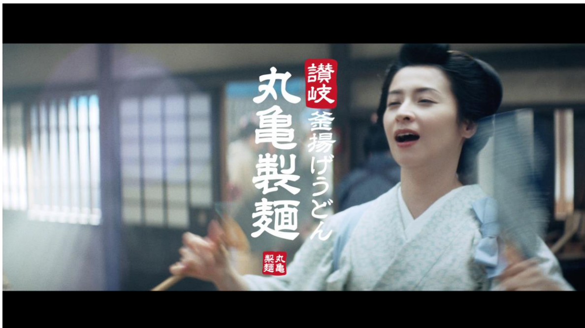
旨辛肉つけうどん『旨辛肉つけうどん』篇

今回のCMも、入念な時代考証を経たセットと、季節を感じさせるロケにより江戸時代風の風景を創りあげました。広くなった店内は、働く町人達でいっぱいです。忙しく働く女将の存在感と、35mmフィルムで撮影しシネマスコープサイズでご覧いただく、映画さながらの世界観にご期待ください。