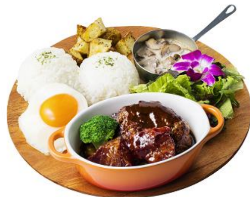
ホリデー ビーフシチュー ロコモコ 1,780円(税別)

フェア期間中に『ベリーメリーホワイトパンケーキ』または『ホリデービーフシチューロコモコ』をご注文いただくと、もれなく『Kona's Coffee ～Mele Kalikimaka～』オリジナルステッカーをプレゼント！