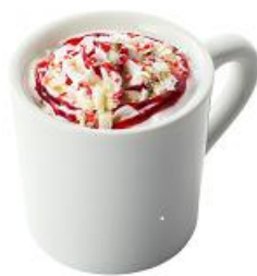
ストロベリーホワイトショコラ 580円(税別)