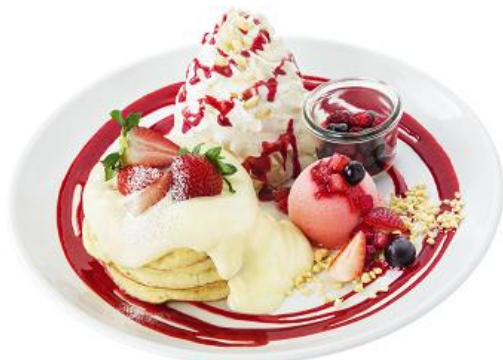
ベリーメリーホワイトパンケーキ 1,580円(税別)