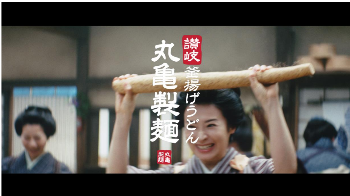
牛とろ玉うどん『牛とろ玉うどん』篇

『牛とろ玉うどん』は、ご注文を頂いてからたっぷりの牛肉を甘辛い割り下で焼き、あつあつでやわらかい牛肉を「ととろ」と「温泉玉子」と一緒に「冷ぶっかけうどん」の上のにのせた、これからの季節に体に元気をくれる一品です。