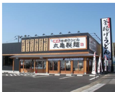
【丸亀製麺店舗イメージ（真岡店）】

本事業は、店舗向けのトータルパッケージ型の省エネルギー事業として、外食産業の中でも先駆けた取り組みとして評価され、国土交通省の「平成22年度第2回住宅・建築物省CO 2 先導事業」に採択されています。本事業の実施により、1店舗あたりのCO 2 削減量は年平均21t-CO 2 （約15%相当）を予定しています。なお、京都伏見店以外の1店舗でも同様に実施を予定しており、京都伏見店と合計2店舗で取り組む方針です。